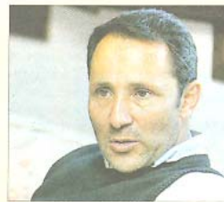
César Rincón/ Torero